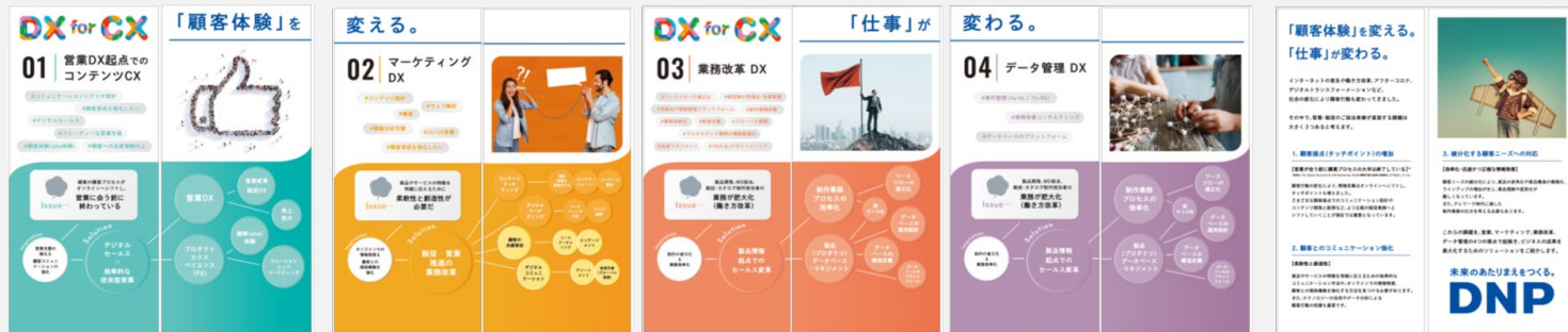
※出展ブースのイメージです。